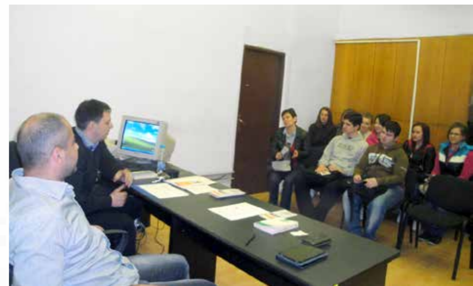
Ден на отворените врати в Пловдив